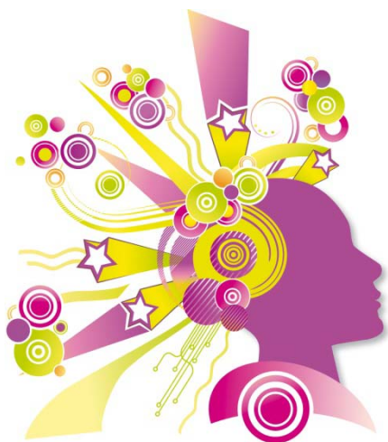
TABLEAU DE BORD Mesurer la performance de son entreprise

15 - 16 octobre 2009 - Parc Expo RENNES Aéroport - Bruz